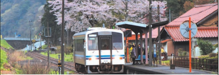
金比羅山公園で桜を見ながら花見弁当