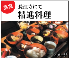
昼食 長江寺にて精進料理