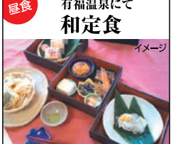
昼食 有福温泉にて和定食