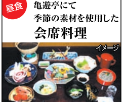
昼食 亀遊亭にて季節の素材を使用した会席料理